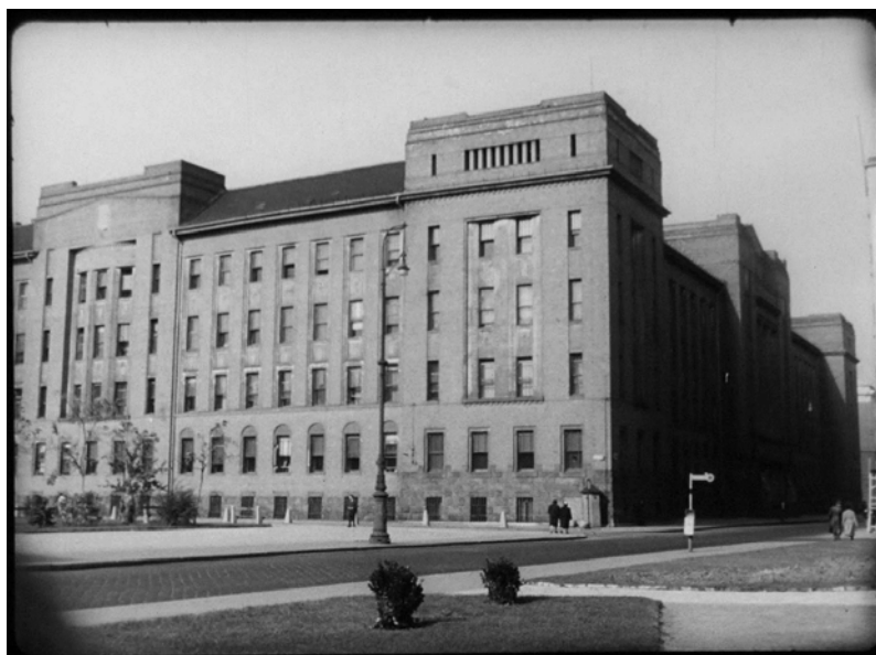
2. sz. kép. A Katonai Bíróság épülete (II. kerület, Fő utca 70-78.).

Az ügyészség tudomásul vette az ítéletet, a vádlott és védője azonban „ a minősítés miatt és enyhítésért fellebbezett ”.