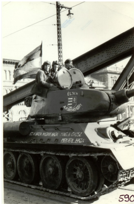
5. kép. Kossuth-címeres harckocsi a Szabadsághídon