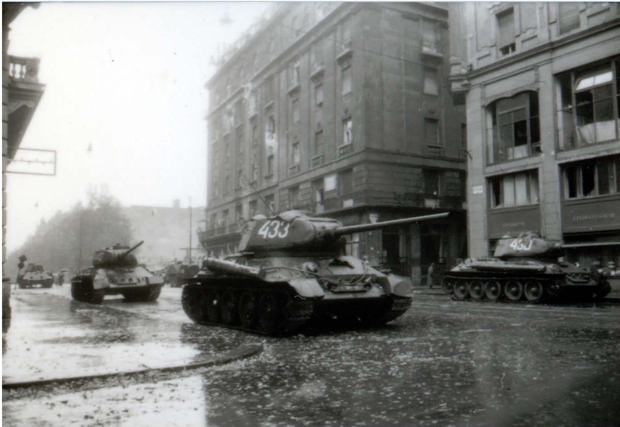
3. kép. T-34-es szovjet harckocsik vonulnak a Kossuth Lajos utcában (BFL XIV.47. Krassó-hagyaték, Erich Lessing felvétele)

Reggelit kaptunk. Délre főzünk. Szerencsére van tartalék a menzán. Kenyér van. A rádió bement reggel, hogy elcsendesedett a harc, helyreállott a rend. Hazugság. A harc folyik. A Nemzeti Múzeum ég. Szörnyű kár. A magyar páncélosok az oroszokra lönek. Az Astoria környékén magyar páncélosok vannak.