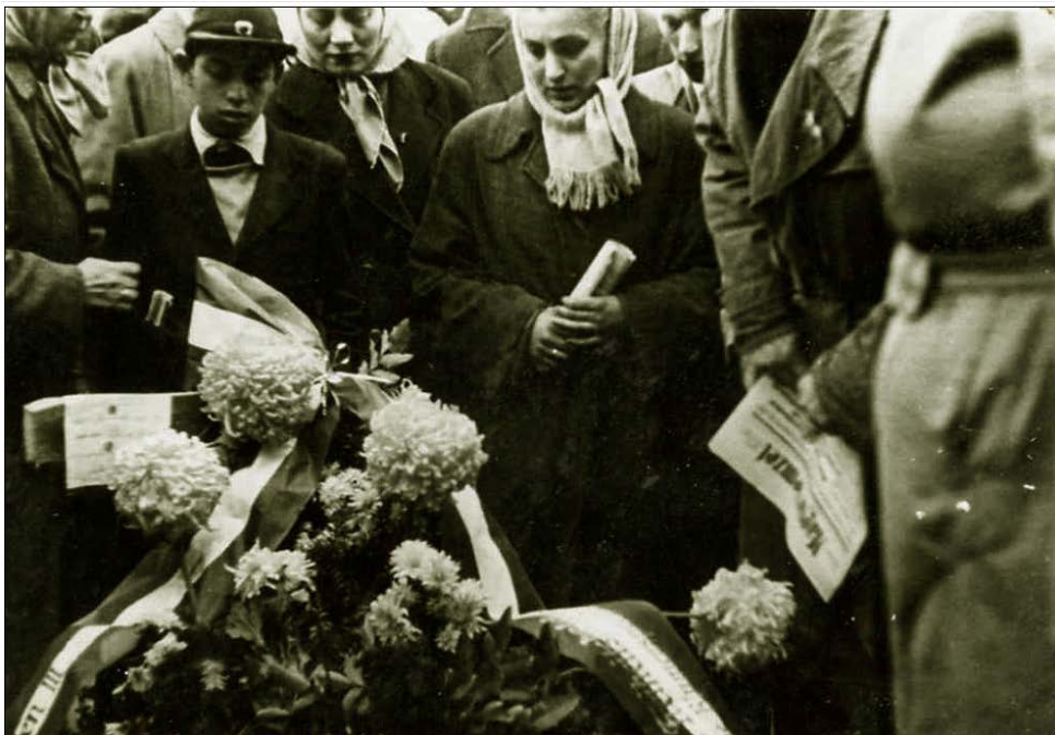
6. kép. Gyászolók egy fiatal sírja körül (BFL XXV.4.f 9024/1959)

Most pedig szóljunk Budapest állapotáról. Borzalmasan néz ki, a Nemzeti Múzeum kiégve, az Astoria kilőve, a rádió épülete összelövdözve, az Alk[almi] Áruház kiégve, a villamosvezetékek leszaggatva, a Rákóczi úton, a Baross utcán égnek meredő falak, a Boráros tér, a Kálvin tér összeveretve, az egyetem kémiai laboratóriuma kilőve és így sorolhatnám tovább. Az Üllői úton, a József körúton ép ablak nincs, a József körúton autó-, ágyúroncsok, bedőlt házak. Ostrom alatt nem nézett úgy ki. Elképzelhető, milyen lehet, amikor a tankok százai harcolnak az utcákon. Új életet kezdünk, új arcot kapsz te is, országunk, forradalmunk műve. Naplóm be is fejezhetem, egy hete már, hogy ifjúságunk, népünk szívéből elemi erővel tör ki a forradalmi láng, hogy lerázzuk magunkról az elmúlt évek igáját, önkényuralmát, hogy megszüntessük megalázó szolgátságunkat.