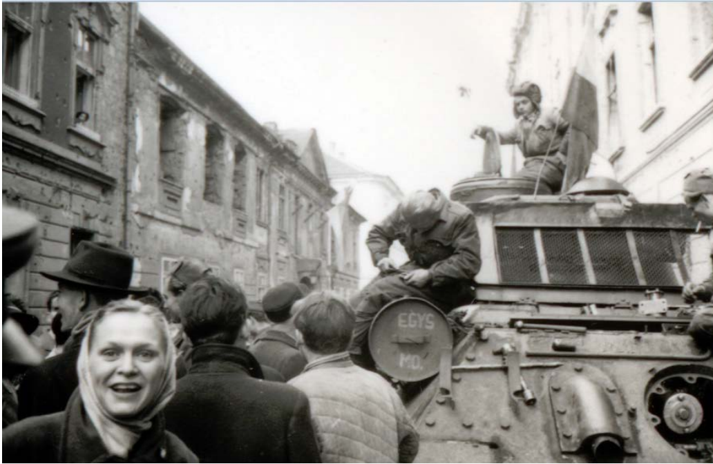
2. kép. A harcok szünetében (BFL XIV. 47. Krassó-hagyaték, Erich Lessing felvétele)