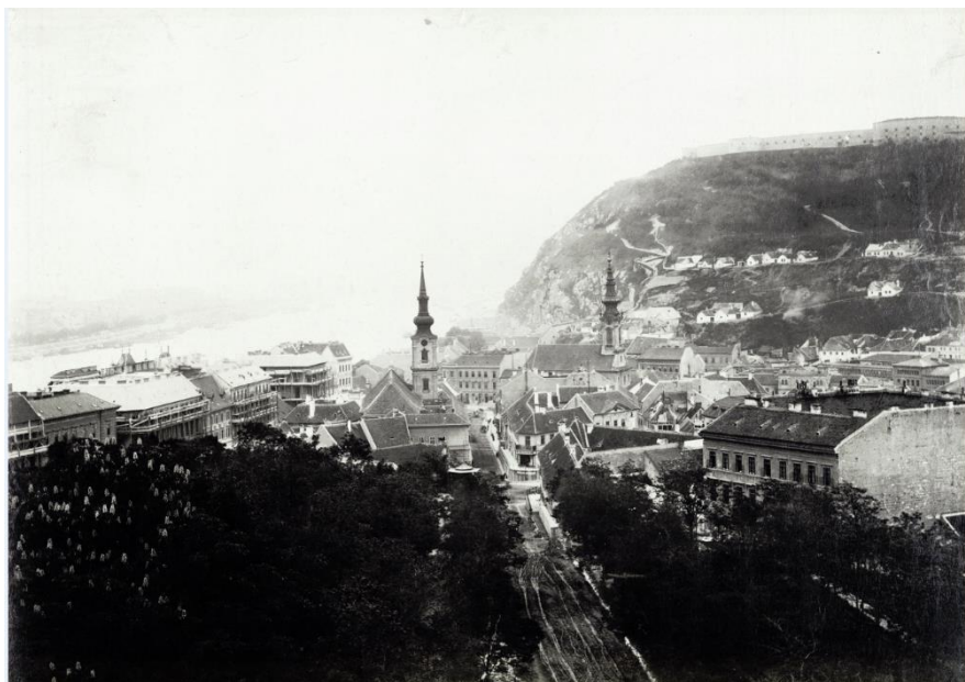
2. kép. A Tabán 1893 után.