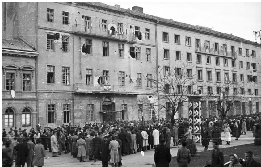
2. kép. Az MDP Budapesti Pártbizottságának székháza az 1956. október 30-i harcok után.

Ami a Péterfy kórházat illeti, a műtési naplóban szereplő esetek a kisebb repesz- vagy szilánkdarabok eltávolításától az egészen súlyos beavatkozásokig mindenféle műtétbe betekintést nyújtanak. Átlagosan napi 4-5 fő ellátását dokumentálták, valójában viszont jóval leterheltebb volt a kórház. Így eshetett meg például az, hogy egy október 26-án lövéses sérüléssel kórházba került férfibeteget a nőgyógyászati osztályon helyeztek el. 9 A Péterfy forradalmi kórház jellegét mutatja, hogy míg október 23-ig elsősorban onkológiai, belgyógyászati jellegű műtési beavatkozások történtek, addig ezek október 24-től jelentősen visszaszorultak a sebészeti műtétek miatt. A kórház orvosainak nyilvánvalóan az október 30-i Köztársaság téri ostrom, valamint november 4-től a szovjetek elleni harc miatt akadt a legtöbb munkájuk. Október 30-án például kizárólag „vulnus sclopetarium”, azaz lövés okozta sérüléseket láttak el, összesen hetet. Ugyanígy november 4-én, majd 6-án és 7-én is hasonlóan kiemelkedő a lőtt seb miatt műtöttek száma. Többségében ezen esetekben súlyos, hasi sérülésekről van szó.