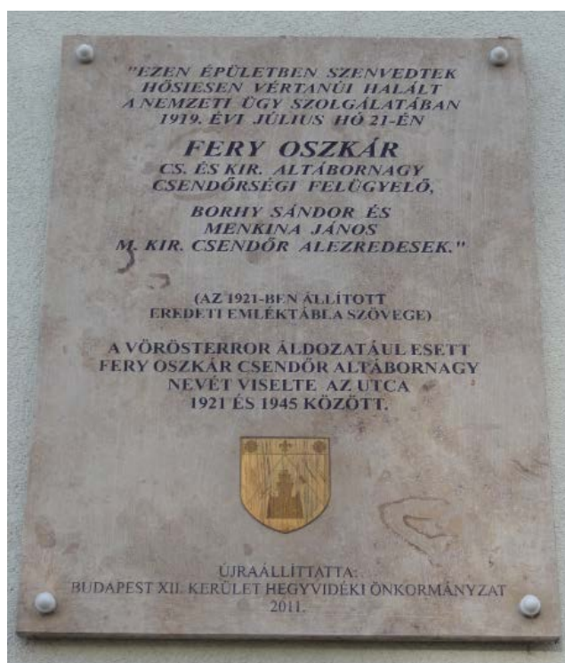
4. kép. Az egykori Tanítóképző Intézet homlokzatán 2011-ben elhelyezett emléktábla.