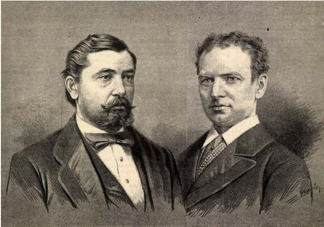
3. kép. Barna Zsigmond (1829 vagy 1832–1883) és Halmi Ferenc (1850–1883) színész portréja (Magyarország és a Nagyvilág, 20. 1883. június 10.)