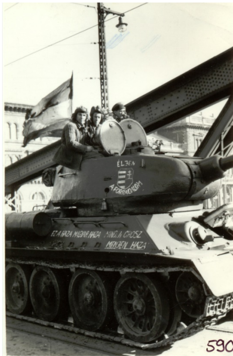
5. kép. Kossuth-címeres harckocsi a Szabadsághídon