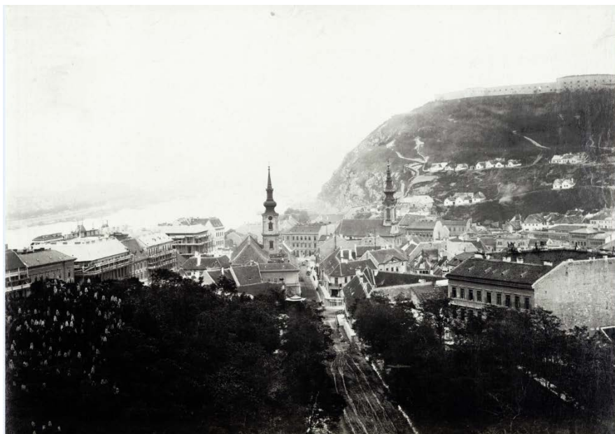
2. kép. A Tabán 1893 után. ( HU BFL XV.19.d.1.08.030 )