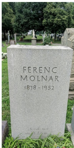
3. kép: Molnár Ferenc sírfelirata

Végrendelet nem maradt utána, százezer dollár vagyonát és a jogdíjak kétharmad részét leánya, egyharmad részét felesége örökölte. 33 Darabjait, hiszen a rendszer „osztályidegennek” tekintette, 1948 és 1956 között nem játszották. 34