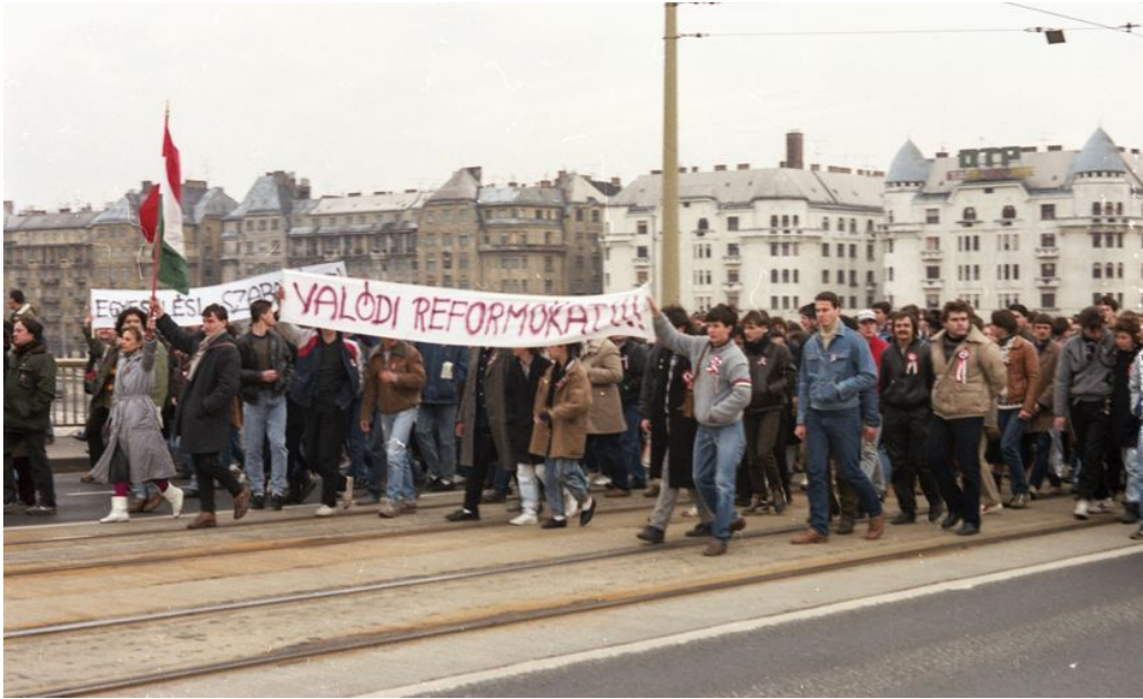
7. kép. Március 15-ei felvonulás a Margit hídon, 1988.

A következő évben – amikor a nap már munkaszüneti nappá vált – a rendőrség rendezvénybiztosítási feladatai között az állam védelme már nem szerepelt önálló elemként. A rendszerváltás folyamatának közepette a helyzet felfogása már megváltozott: a rendőrségi utasításban már csupán a közrend, a közbiztonság védelme és a rendezvények zavartalan biztosítása szerepelt, a tüntetést már nem tekintették a belső ellenállásnak. 42